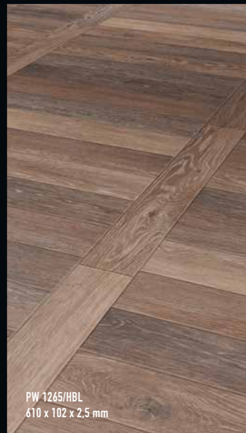
PW 1265/HBL 610 x 102 x 2,5 mm