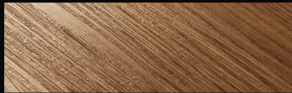
PW 3065/HB PW 3065/HBL