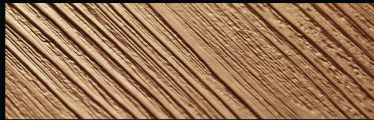
PW 3066/HB PW 3066/HBL