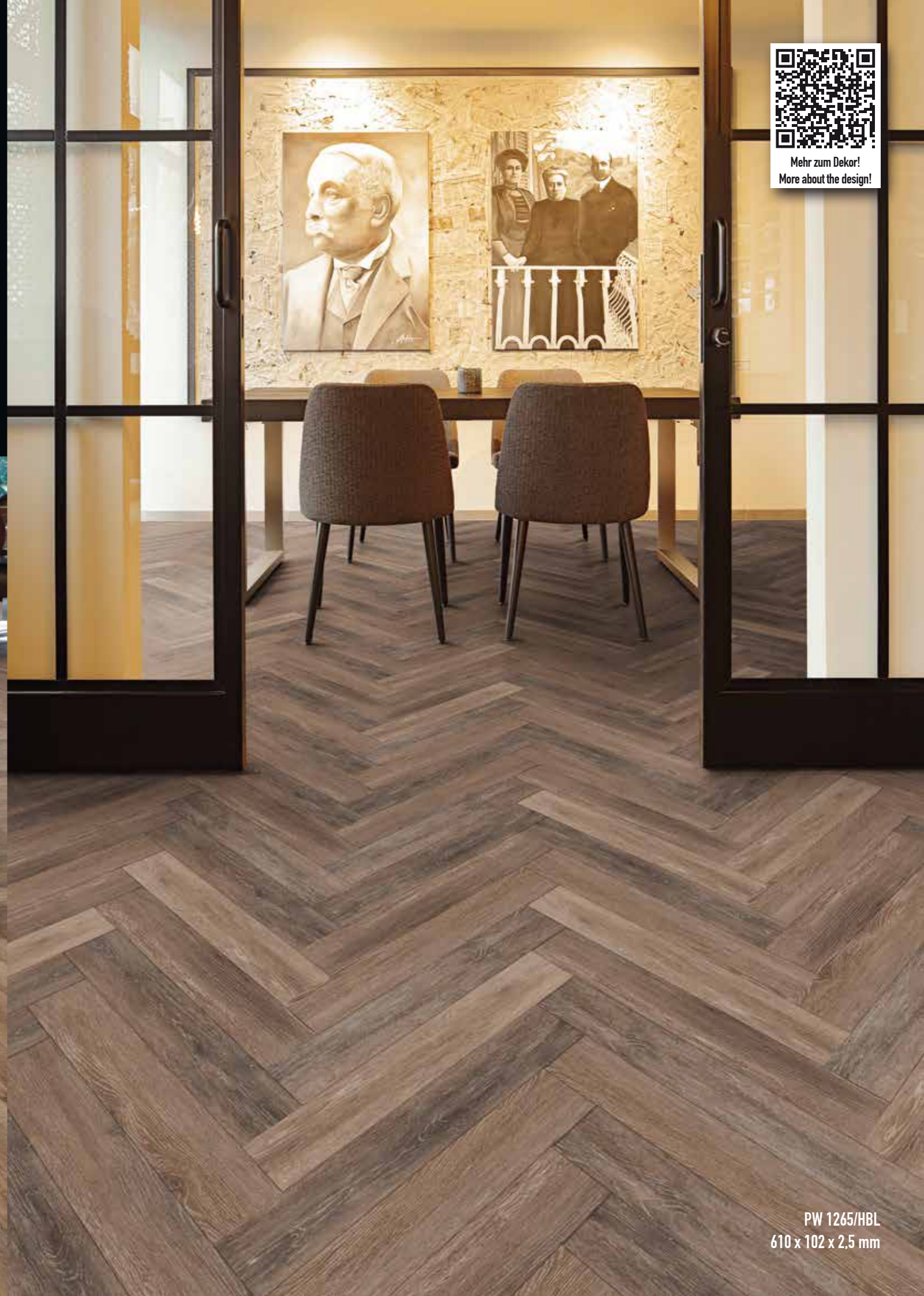
PW 1265/HBL 610 x 102 x 2,5 mm