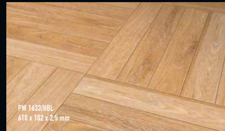
PW 1633/HBL 610 x 102 x 2,5 mm