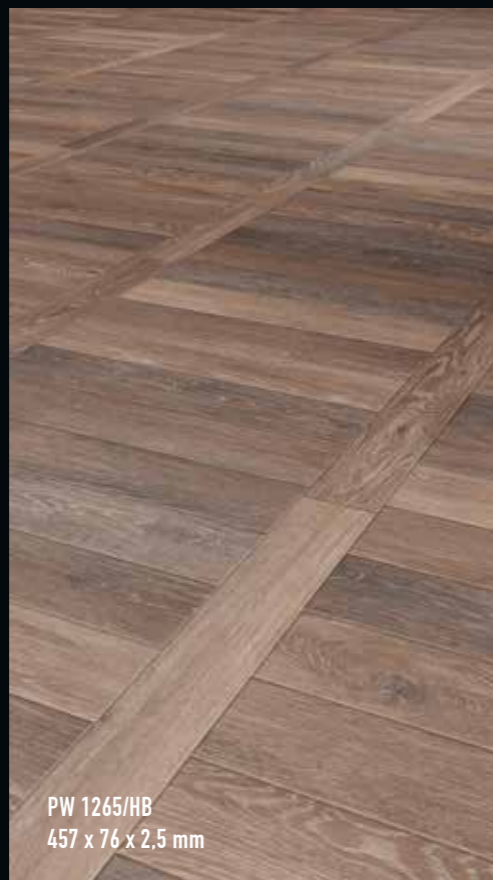
PW 1265/HB 457 x 76 x 2,5 mm

Ladder-style floors are one of the classic wooden flooring styles. They have their origins in a time when floor patterns set the tone for interior designs. The distinguishing feature of this style comprises a row of individual crosswise planks which alternate with elements arranged in a lengthwise row. Ladder-style floors are one of the typical patterns in strip parquet floorings. They can create space-defining patterns, especially in expansive rooms in line with today's dominant trend in rustic look flooring. Smaller rooms also benefit from a ladder formation since it creates a sensation of space and makes the room look bigger. The smaller herringbone planks in the special format measuring 457 x 76 x 2.5 mm and 610 x 102 x 2.5 mm are particularly suitable.