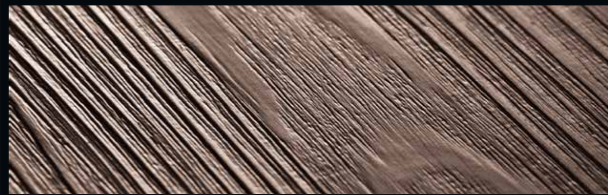
PW 1265/HB PW 1265/HBL