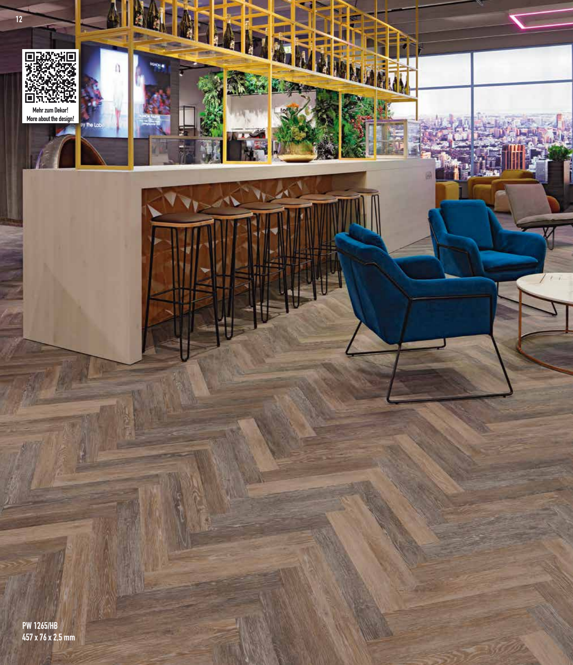
PW 1265/HB 457 x 76 x 2,5 mm