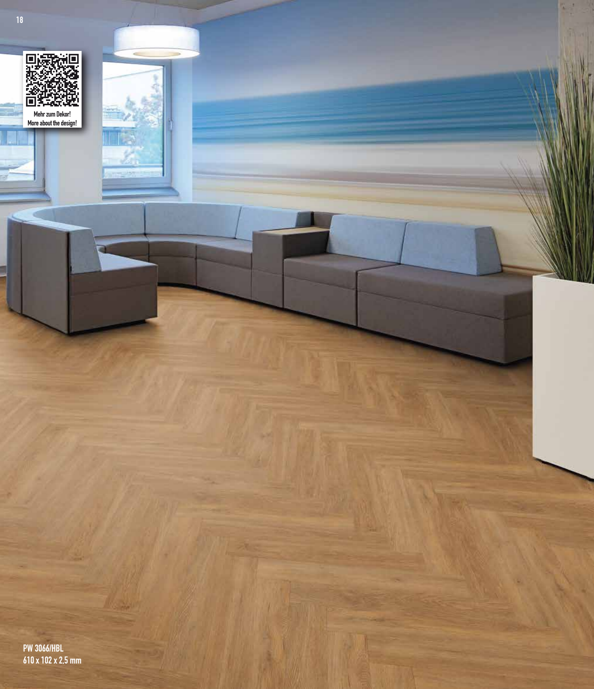
PW 3066/HBL 610 x 102 x 2,5 mm