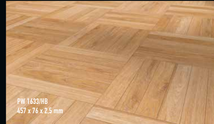
PW 1633/HB 457 x 76 x 2,5 mm