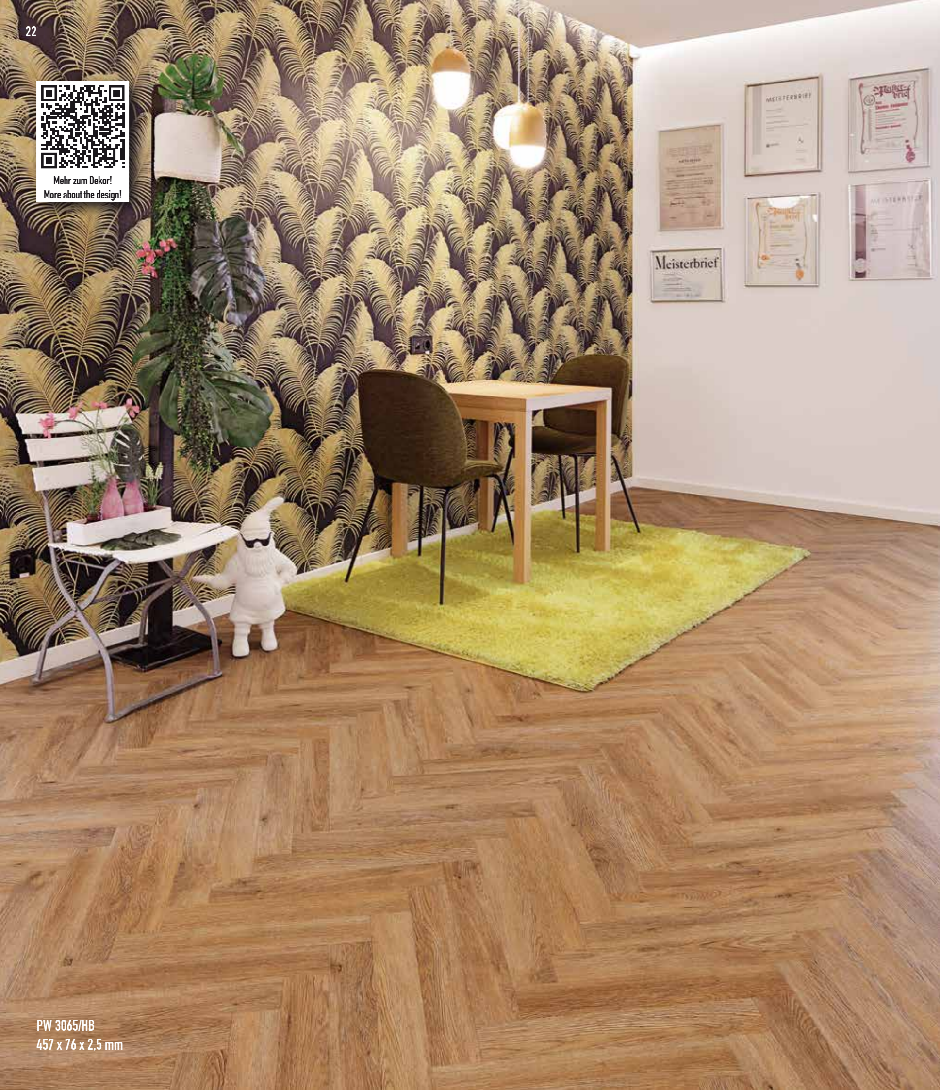
PW 3065/HB 457 x 76 x 2,5 mm