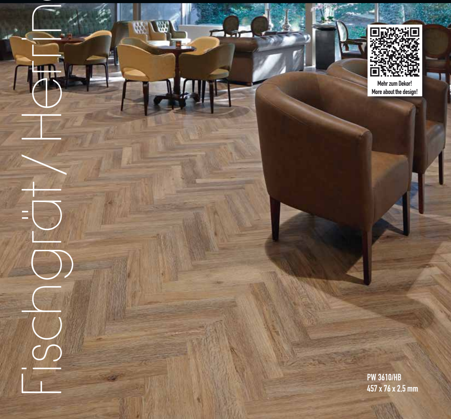
PW 3610/HB 457 x 76 x 2,5 mm